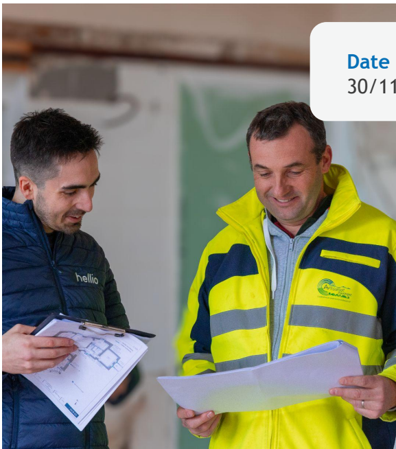
Tableau de recensement