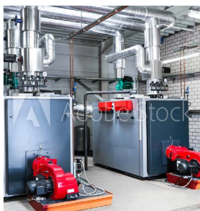
Remplacement de chaudière