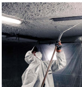
Isolation des planchers-bas