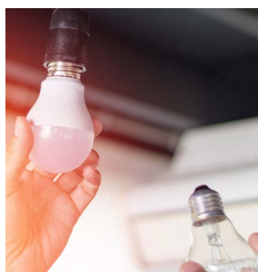
Installation de lampes à LED