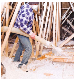
Isolation des combles