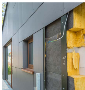
Isolation des murs par l'extérieur