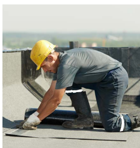
Isolation des toi- tures-terrasses